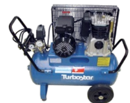
Kompressor für die Druckprüfung mit Luft