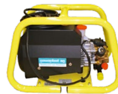
Hochdruckpumpe für die Druckprüfung mit Wasser